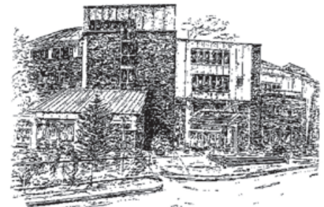
MEDIAN Kinderklinik „Tannenhof“ 1998