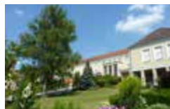
Quellbrunn-Klinik Parkstraße 8a 99438 Bad Berka