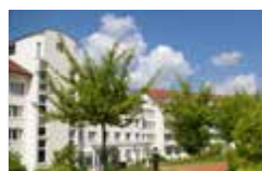
Ilmtal-Klinik Turmweg 2 99438 Bad Berka