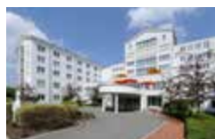
Adelsberg-Klinik Erlenweg 2 99438 Bad Berka

Das MEDIAN Reha-Zentrum Bad Berka besteht aus drei modernen Kliniken mit circa 450 Betten, in denen unsere Gäste fachübergreifend betreut werden: