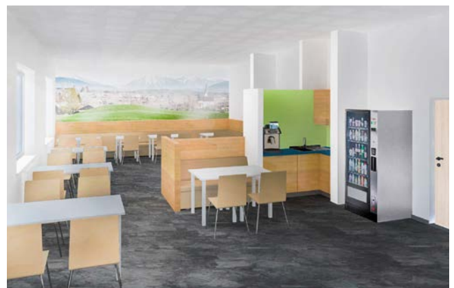
Neuer Lounge-Bereich im Erdgeschoss