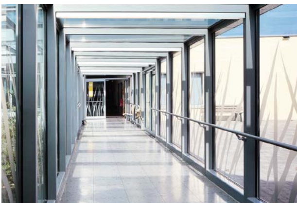
Verbindungsgang zwischen Alt- und Neubau