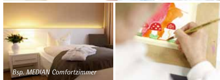
Bsp. MEDIAN Comfortzimmer