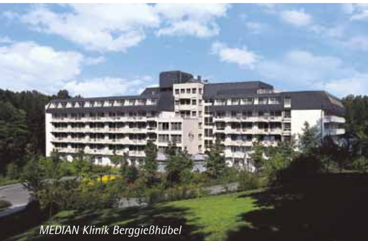
MEDIAN Klinik Berggießhübel

Nach Begutachtung der Therapiekonzeption durch den MDK besteht ein Belegungsvertrag mit der AOK plus. Das positive Votum des MDK gilt auch für andere Krankenkassen; die AOK plus wird die Konzeption im Landesverband der sächsischen Krankenkassen (LVSK) vorstellen.